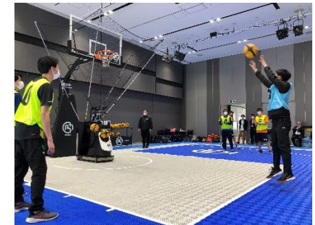
シューティングマシンも活用し スムーズな練習を実現