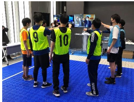
遠隔指導を受けながら 練習を開始する受講生