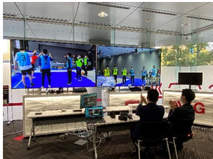
遠隔地から指導を行う 広島ドラゴンフライズのコーチ